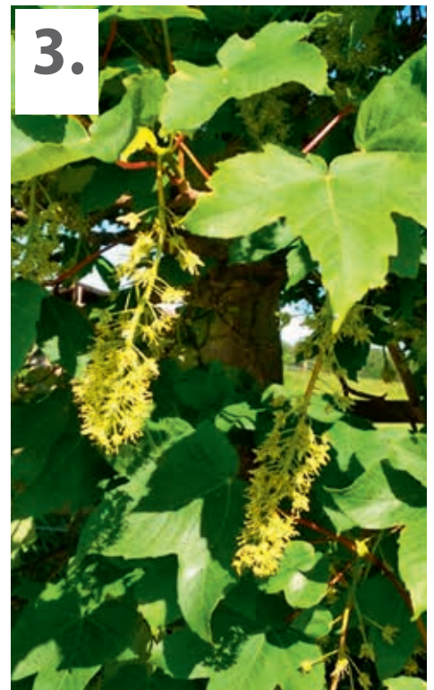
1. šiška (modřín) 2. květ (dub) 3. květ a list (javor) Odpovědi:

Kvasické noviny , čtvrtletník. Periodický tisk samosprávného celku.