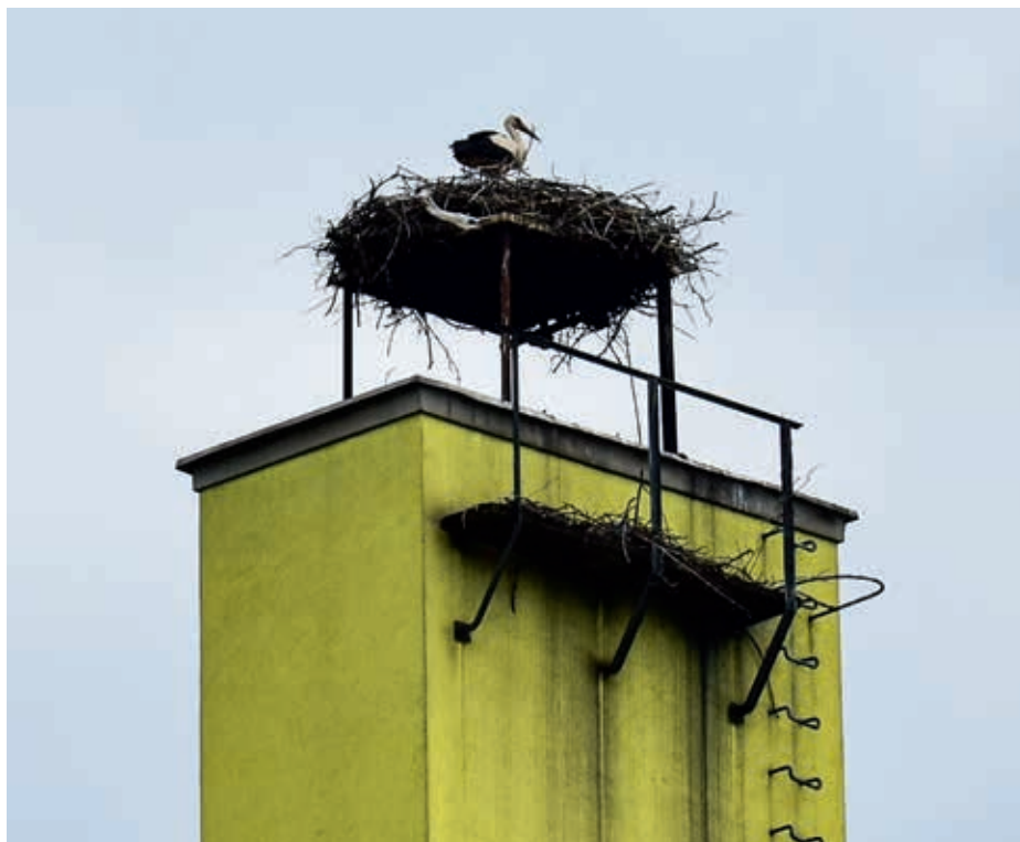
Na komíně kvasické základní školy hnízdí čáp.