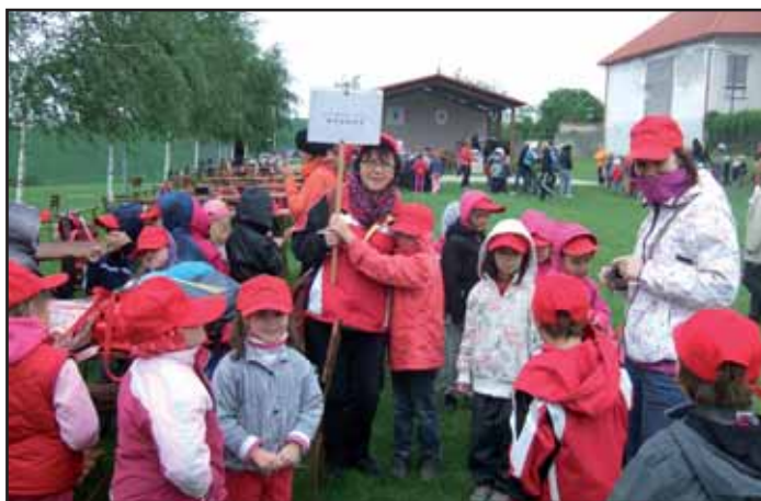
Karolín žil olympiádou.