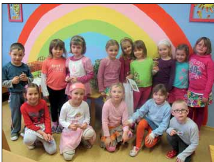
Sluníčka malovaly i děti z MŠ Kvasice.