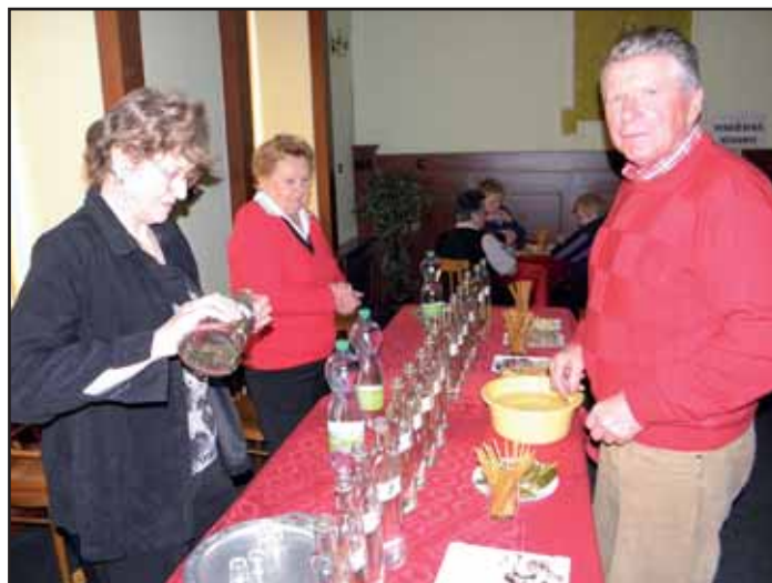
Kvasický košt pálenek.