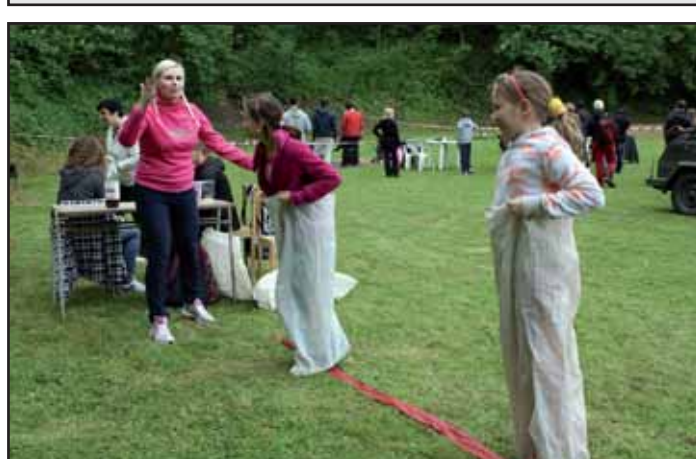
Skákání v pytli.