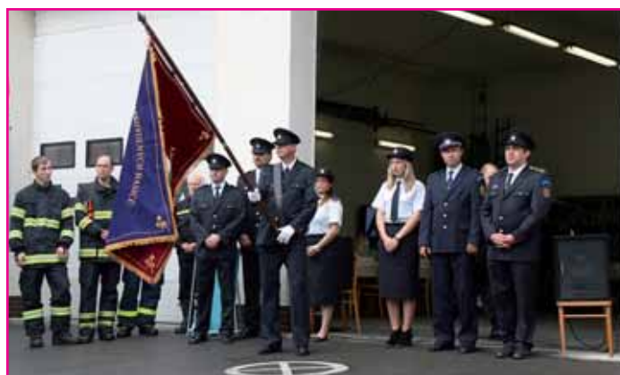
Kvasičtí hasiči se svým novým praporem.