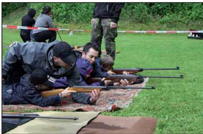
Soutěž ve střelbě.