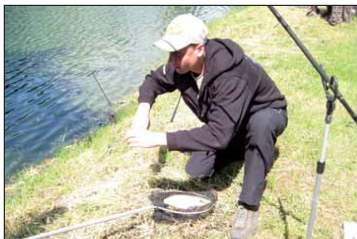
Dětské rybářské závody.