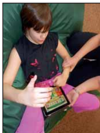
Zajímavá pomůcka pro děti.

Žáci ZŠ speciální pracují s pomůckou tablet především v předmětech Rozumová výchova, Rozumová a řečová výchova, Smyslová výchova a jeden žák ho používá v rámci předmětu Informační technologie. Pomůcka je mezi jednotlivými třídami v Kvasicích zapůjčována dle aktuální potřeby. Činnost probíhá buď s plným vedením či pouze slovním doprovodem pedagoga nebo zcela samostatně. Aplikace a produkty, které jsou pomůckou i-Pad podporovány a které lze do tabletu pro žáky stáhnout, jsou z různých oblastí všeobecného rozvoje. Patří mezi ně například: Aplikace pro všeobecný rozvoj, Aplikace pro řečový rozvoj, Aplikace pro podporu čtení a psaní, Aplikace pro rozvoj předmatematických a matematických představ, Aplikace pro pasivní sledování, relaxace a motivace, Aplikace vhodné pro smyslová postižení, Aplikace podporující strukturu a vzdělávání dětí s PAS (poruchy autistického spektra) - a nejen po ně, protože struktura vyhovuje většině dětí se speciálními vzdělávacími potřebami.