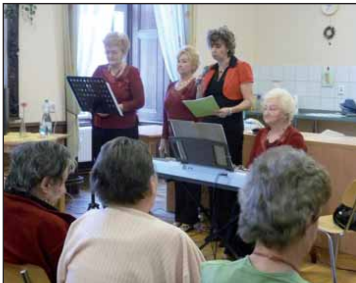
Hudební dopoledne - skupina Návraty.