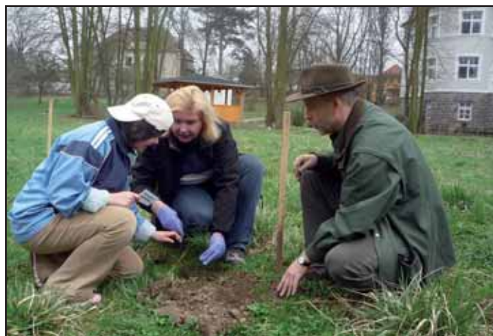
Sázení nového parku.