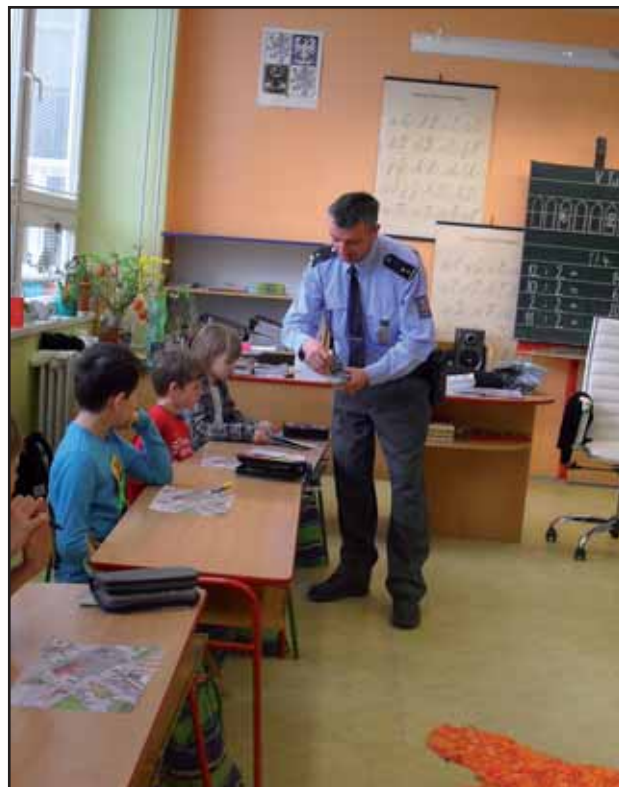
Preventivní program AJAX.