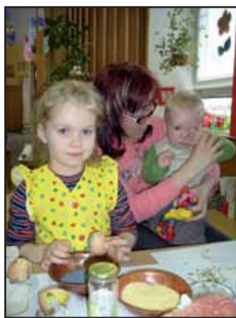
Velikonoční dílny.