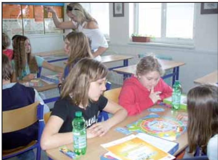
Košík plný rozumu.

Dověděli jsme se, jak se zachovat a co dělat, když dojde ke zranění. Vysvětlili jsme si, jak ošetřit odřeninu, popáleninu, jak pomoci při přehřátí organismu, jak zastavit krvácení. Vyzkoušeli jsme si obvázat „zraněná místa“ na ruku, na no-