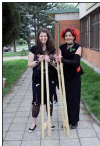
Starší čarodějnice.

K závěru měsíce dubna patří vítání jara. Konec zimy a příchod teplého počasí se oslavuje různými způsoby. V Kvasicích se páli čarodějnice a staví se máj. 27. dubna 2013 se před kostelem Husova sboru slétaly čarodějnice všech věkových kategorií. To aby společně prošly částí obce a svůj průvod zakončily před místní hasičskou zbrojnicí. Zde pro ně bylo přichystáno občerstvení a také nejrůznější dovednostní hry. Po ukončení soutěží dostala každá z čarodějek sladkou odměnu a vysvědčení. A to již nastal čas pro místní dobrovolné hasiče, aby společně se statnými dobrovolníky vztýčili máj. Letitá praxe a dobré velení je základem úspěchu. Netrvalo dlouho a znak Kvasic na špičce postavě-