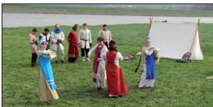
Skupina Nuntius Regis.