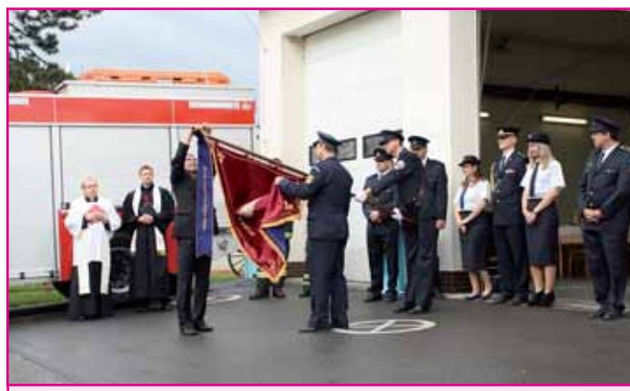
Slavnostní svěcení praporu.