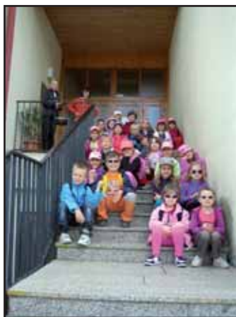
Děti v přírodě.

DĚKUJEME VŠEM RODIČŮM, KTEŘÍ POMÁHALI MATEŘSKÉ ŠKOLE KVASICE PŘI STAVBĚ PÍSKOVIŠTĚ, SÁZENÍ TUJÍ NA ŠKOLNÍ ZAHRADĚ, STĚHOVÁNÍ KLAVÍRU A PŘI DALŠÍCH PRACÍCH PRO MŠ. ŘEDITELKA MŠ MILUŠE KOLÁČKOVÁ