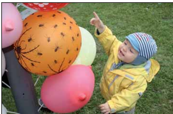
Den dětí na střešnici.