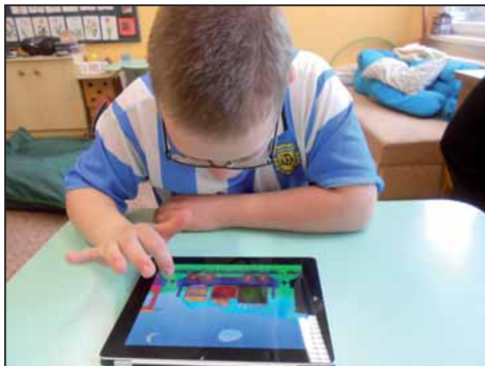
Zajímavá pomůcka pro děti.