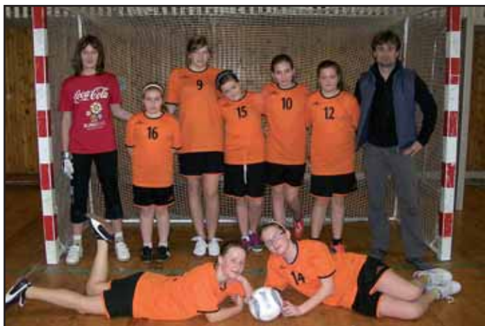
Holky z Kvasic jsou nejlepší.

30. dubna 2013 se konalo ve Zlíně krajské kolo soutěže Košík plný rozumu. Z naší školy se zúčastnili čtyři žáci. Krajské kolo probíhalo dvoukolově. V prvním se nám velmi dařilo - všichni naši reprezentanti postoupili do finále. Ve druhém kole nám sice pražské finále uteklo, přesto jsme dosáhli výborných výsledků: