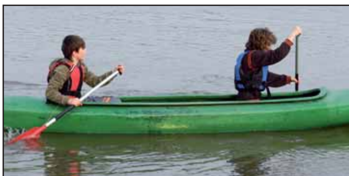
Projížďka po Moravě.