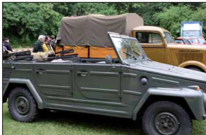
Historická vojenská vozidla.