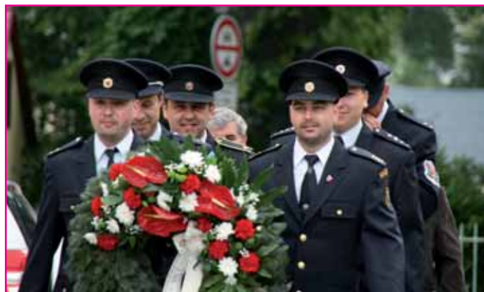
Položení věnce k soše sv. Floriána.