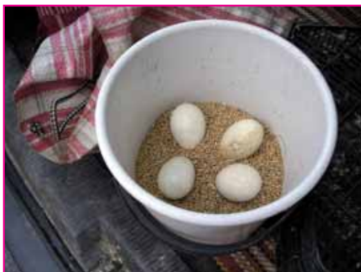
Vajíčka čápi rodinky.