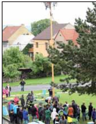
Oslavy SDH.