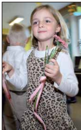
Den matek.