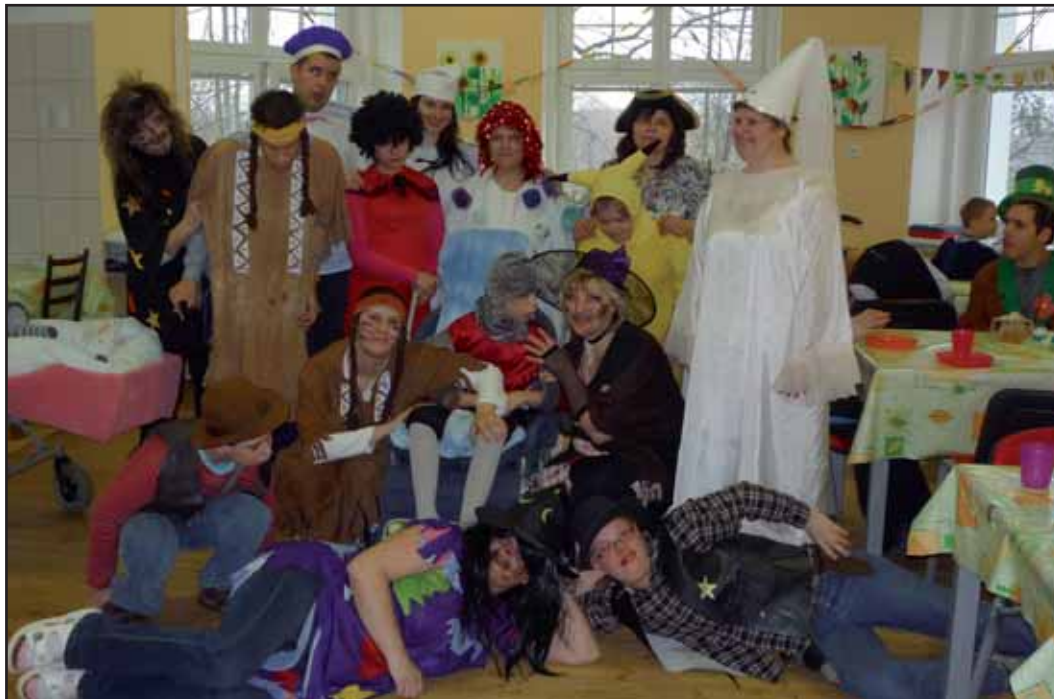
Jaro přivítali uživatelé DZP veselým masopustním rejžem v maskách.