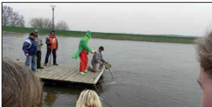
Vodník Čanda odemýká Moravu.