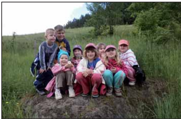
Děti v přírodě.