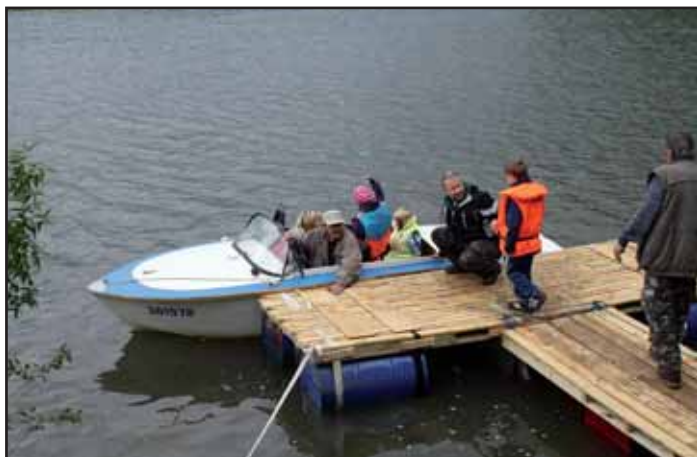
Projížďka po Moravě.