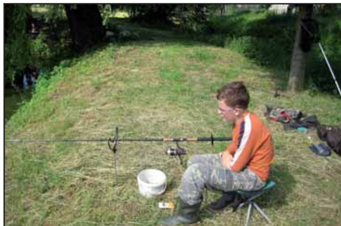
Dětské rybářské závody.