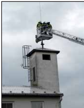
Zásah profes. hasičů.