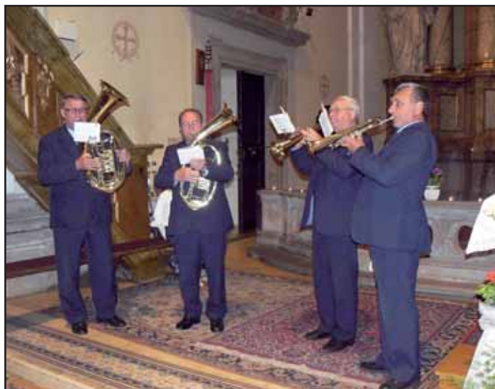
Žesťové kvarteto „Valašský expres“.

Supported by a grant from Switzerland through the Swiss Contribution to the enlarged European Union