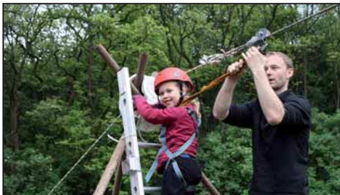
Jízda na lanové dráze.